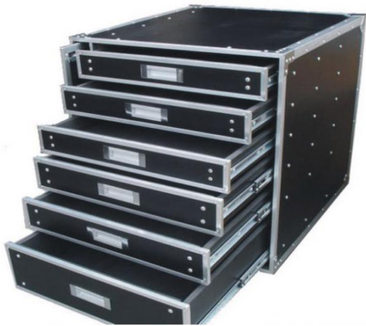
Flight-case Tiroirs 13U Réf 103730