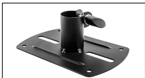
Adaptateur HP Alu Rectangulaire Pour UGS 220/340 Réf 103720