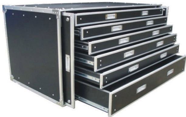
Flight-case Tiroirs XXL Réf 103754