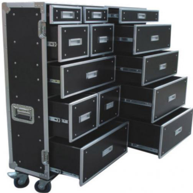
Flight-case Tiroirs Double Réf 103731