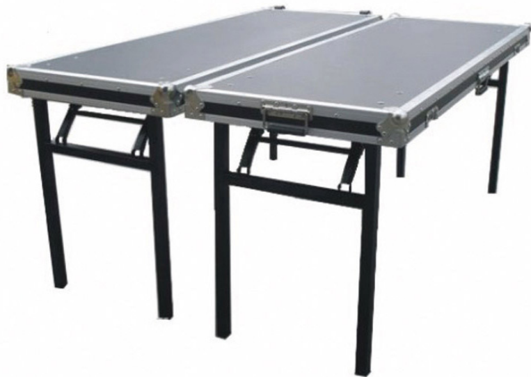
Flight-case Table Réf 103753