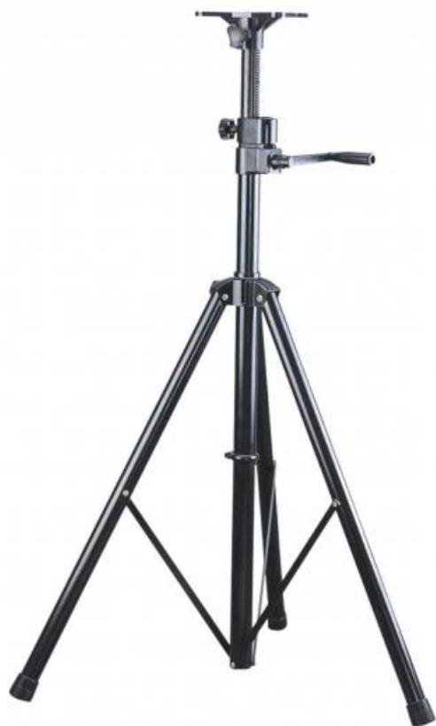
UGS 340 Réf 103717

Hauteur réglable : 2150 - 3400 mm Charge maxi. : 40 kg Matériau : Aluminium