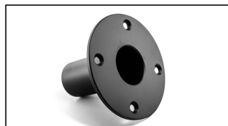
Adaptateur HP Alu rond Pour UGS 220/340 Réf 103719