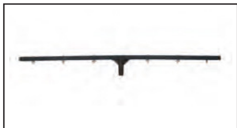
T-BAR pour UGS 220/340 Réf 103718